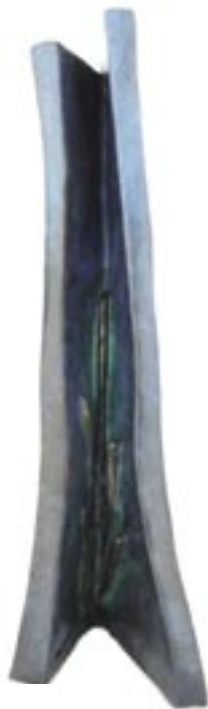
Introspection bronze 2003 41,5 x 26,5 x 21