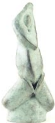
Nataraja bronze 2003 42 x 19 x 10