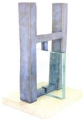
La porte 2 bronze et verre 2003 41,5 x 26,5 x 21