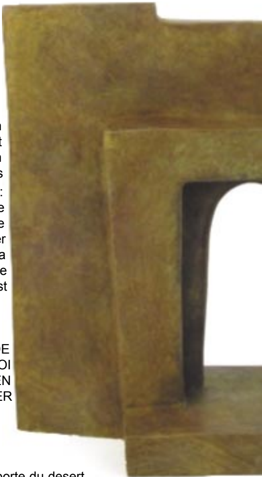
La porte du desert

En outre, CREER DE L'IMAGE ETAIT POUR MOI UNE REPOSE, UN MOYEN TANGIBLE DE COMPENSER L'ABSENCE DU REGARD.