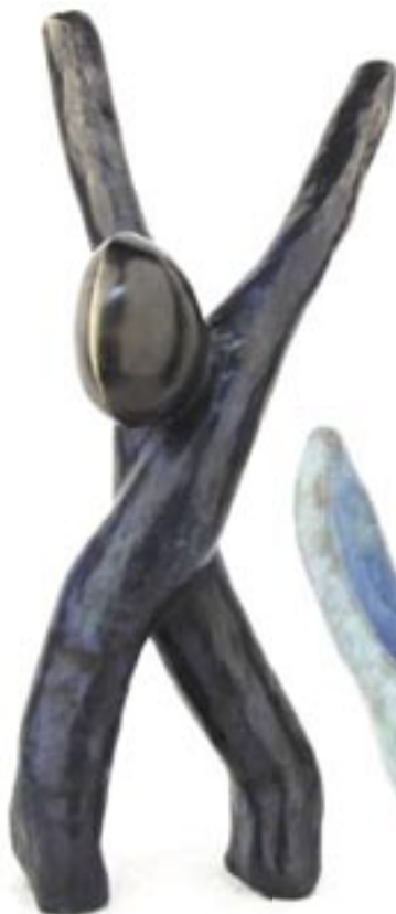
Dissidence bronze 2003 58 x 27 x 14