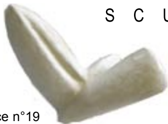
Pièce n°19 céramique 2003 25 x 21,5 x 19