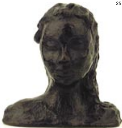
Gaëlle bronze 2003 19 x 18 x 12