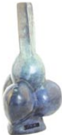
Aximundi 2 bronze 2003 32 x 15 x 15