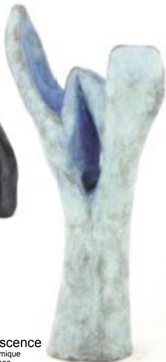
Inflorescence céramique 2003 32 x 15 x 10