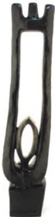
Solstice bronze 2003 74 x 16 x 14