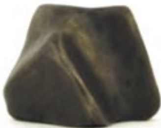
Objet à toucher céramique 2003 12,5 x 10 x 10