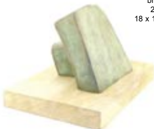
Le livre bronze 2003 18 x 15,5 x 14