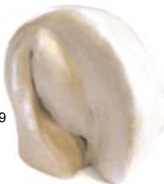
Pièce n°19 céramique 2003 25 x 21,5 x 19